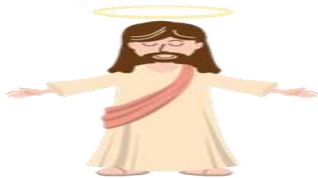
na qemati a Cemas 造物主