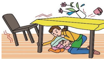
lemuni anga 地震了