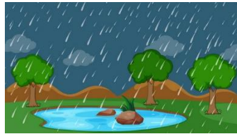
qemudjalj paseqaca 豪大雨