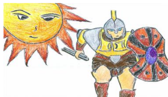
qadaw a pinaka cemas 太陽神