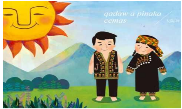
sevalitan na ljemakev tjanuitjen. (是祖靈守護我們。)