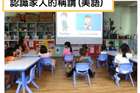
認識家人的稱謂(美語)