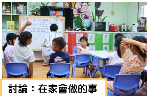
討論：在家會做的事