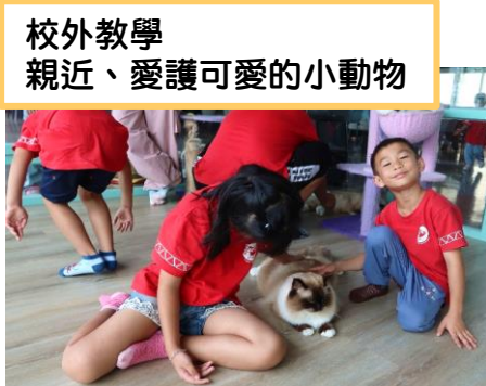
校外教學 親近、愛護可愛的小動物