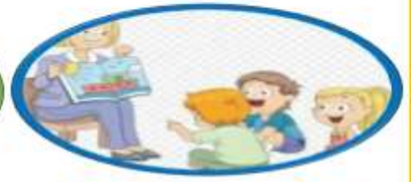
qbahang endaan (聽故事)