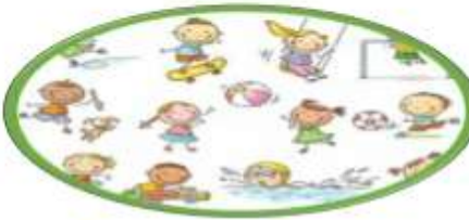
psbiyax hiyi (大肌肉活動)